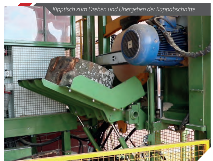
Kipptisch zum Drehen und Übergeben der Kappabschnitte