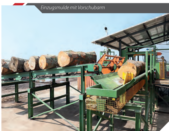
Einzugsmulde mit Vorschubarm

Nach dem Schnitt wird der Kappabschnitt von einem hydraulischen Tisch um 90° gekippt und auf den Einzugstisch der TB – Vertikal-Spalтанlage übergeben.