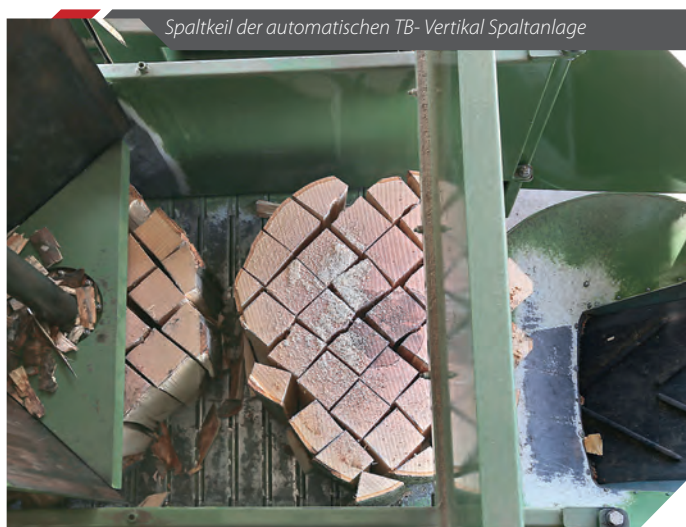
Spaltkeil der automatischen TB-Vertikal Spaltanlage

Die Produktionsleistung der TB900 beträgt 18 bis 20 Schüttraummeter/Std bei Scheitlänge 250mm und –größe 90x90mm.