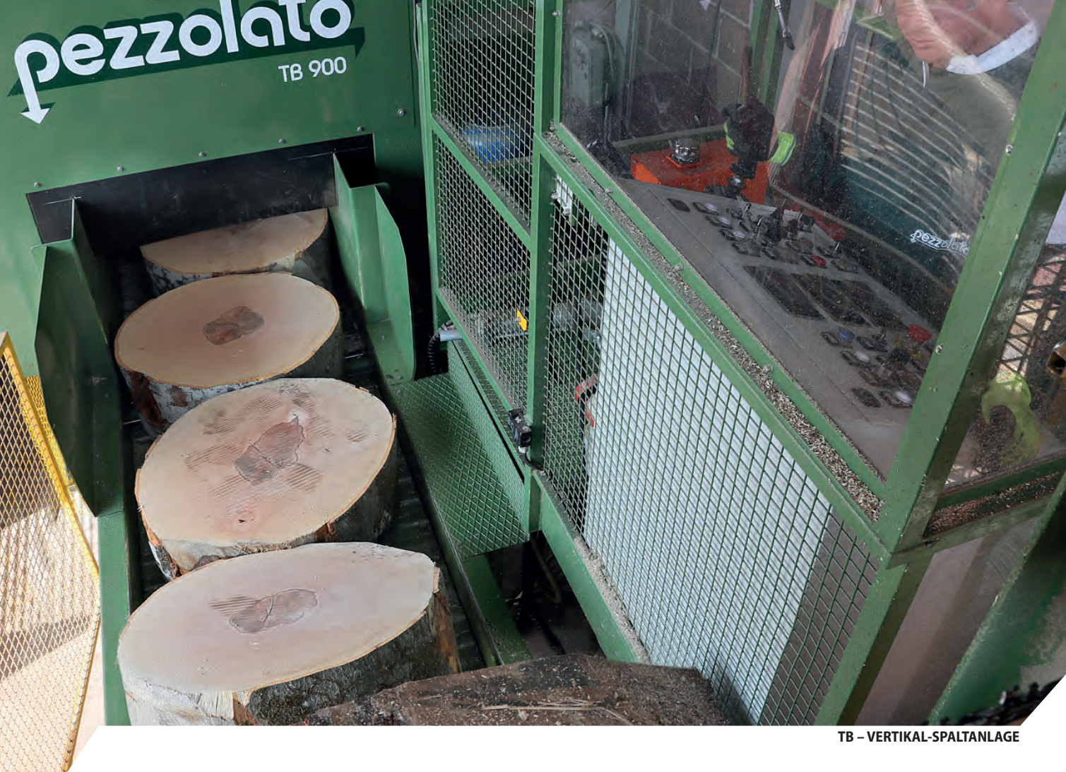
TB – VERTIKAL-SPALTANLAGE