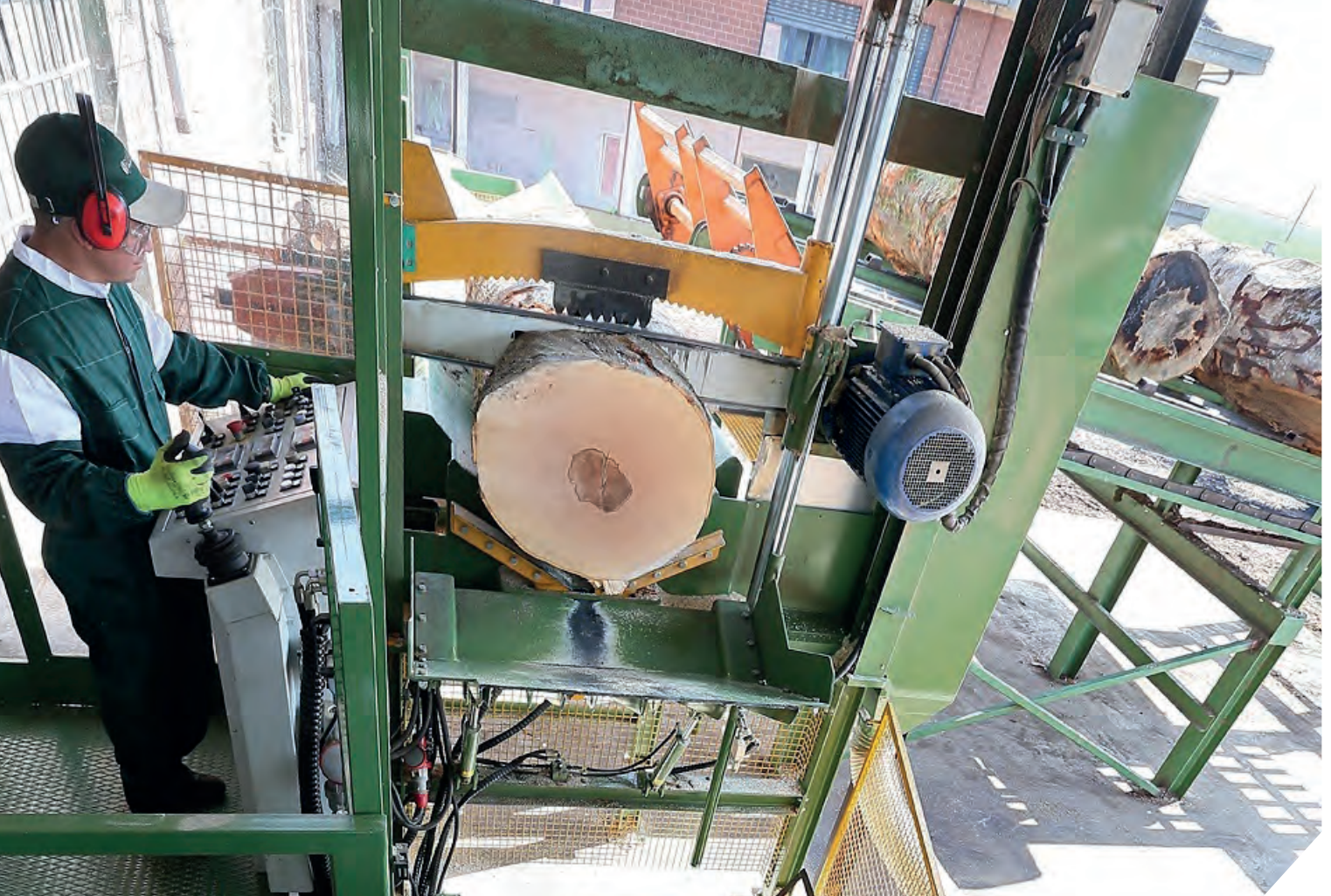
TM - KAPPSTATION