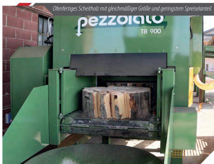
Ofenfertiges Scheitholz mit gleichmäßiger Größe und geringstem Spreiselanteil.