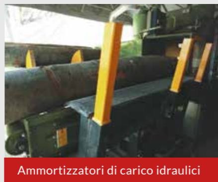
Ammortizzatori di carico idraulici