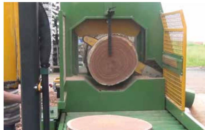
Troncatrice a catena

La macchina è stata concepita perché un solo operatore, alternando l'operazione di taglio a quella di spacco, ottenga dei risultati soddisfacenti: con due operatori la produttività è eccezionale!