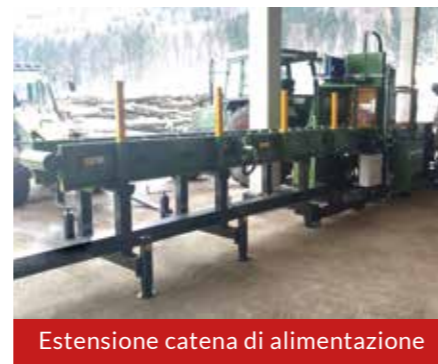
Estensione catena di alimentazione