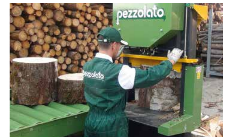
Doppio comando idraulico manuale per spaccalegna