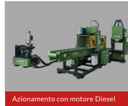
Azionamento con motore Diesel