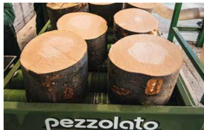
Tavolo a rulli motorizzati per trasferimento ceppi tagliati