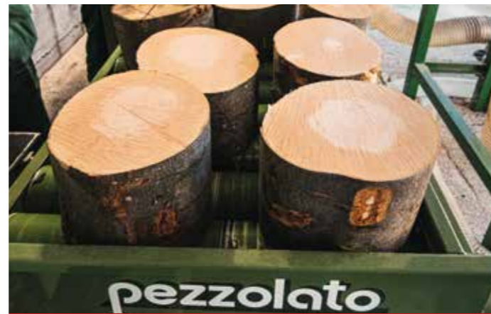
Rollengang mit hydr. angetriebenen Rollen