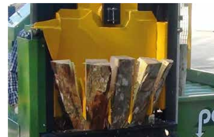
Spaltkeil mit 4 Orbitalmessern mit 5 Scheiten

Dank eines großen Lagers kann Pezzolato innerhalb von 24/48 Stunden Ersatzteile weltweit direkt zum Kunden nach Hause liefern.