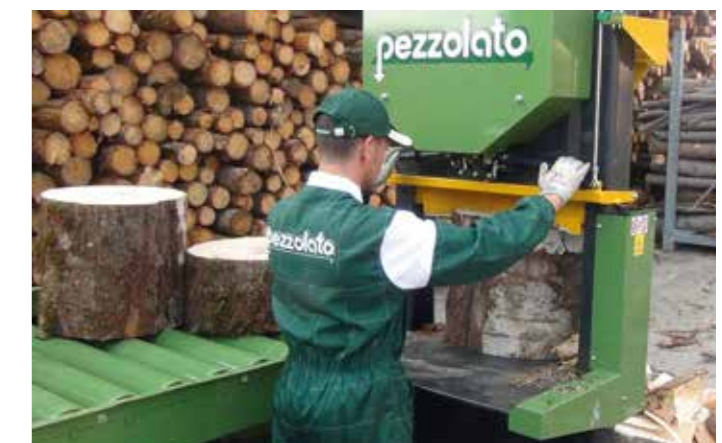
Hydr. Zwei-Hand-Bedienung für den Spalter